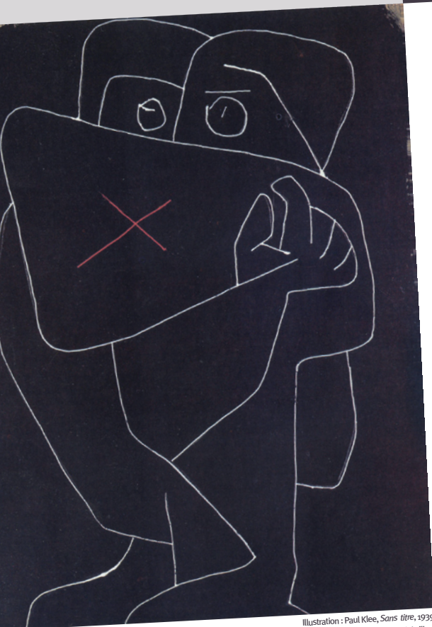
Illustration : Paul Klee, Sans titre , 1939

Conception et réalisation : service communication MESHs - Impression : Université Lille 3