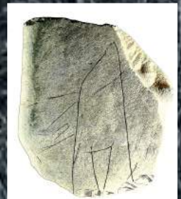
Gargas