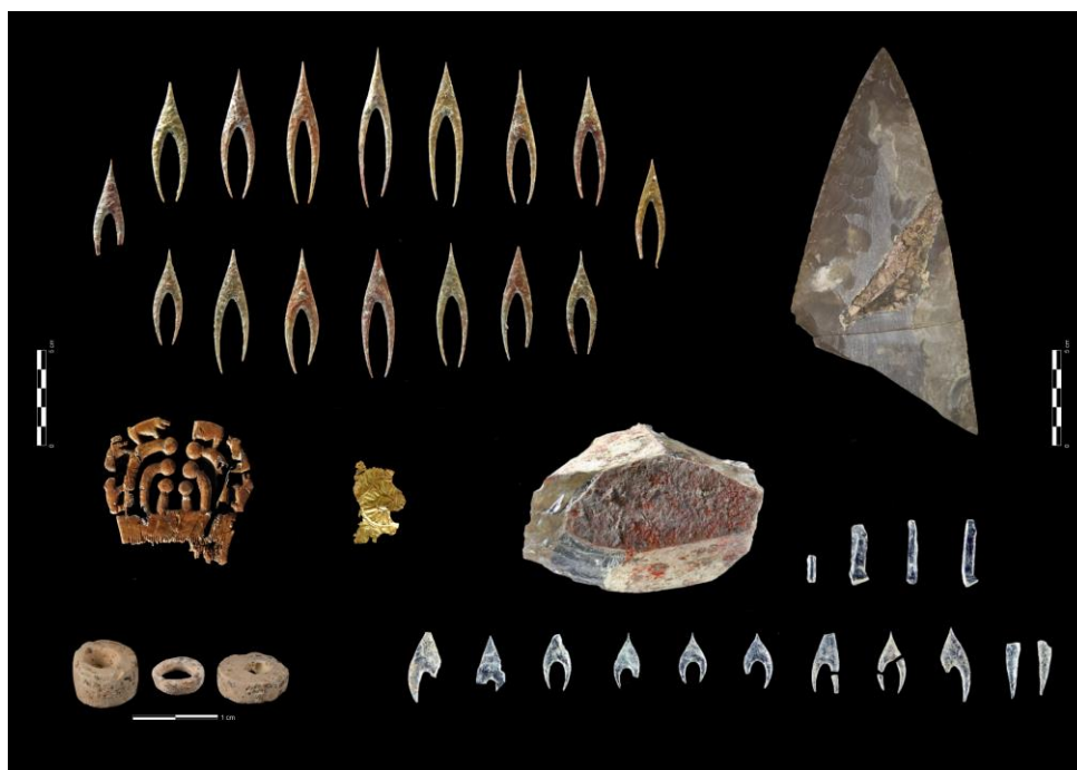
Mobilier du dolmen de Montelirio (Valencia)

Quelles formes d'émergence et de développement du premier mégalithisme de la façade atlantique française ?