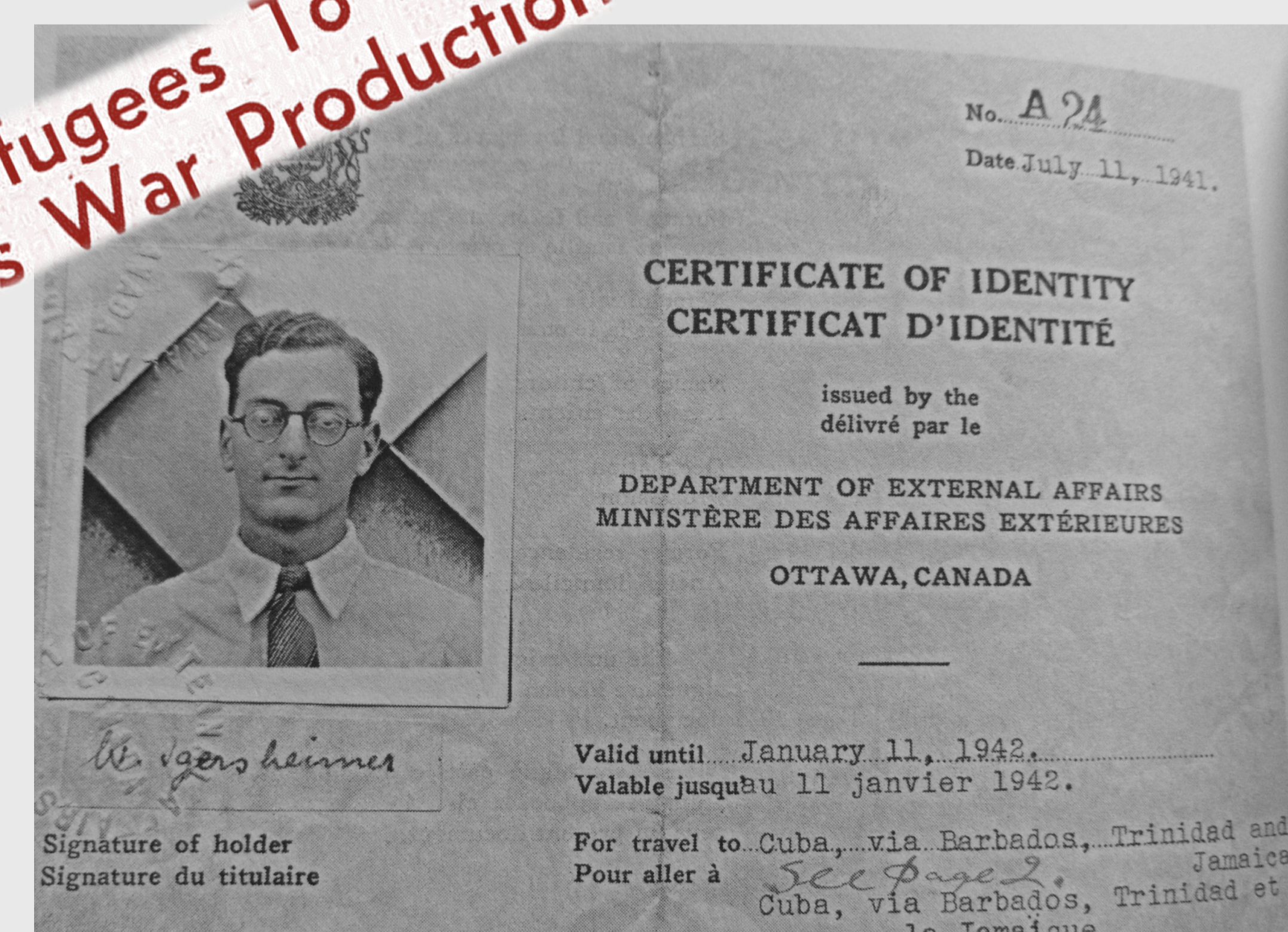
Certificat d'identité permettant de quitter le territoire canadien.

Alien Refugees To Aid Canada's War Production