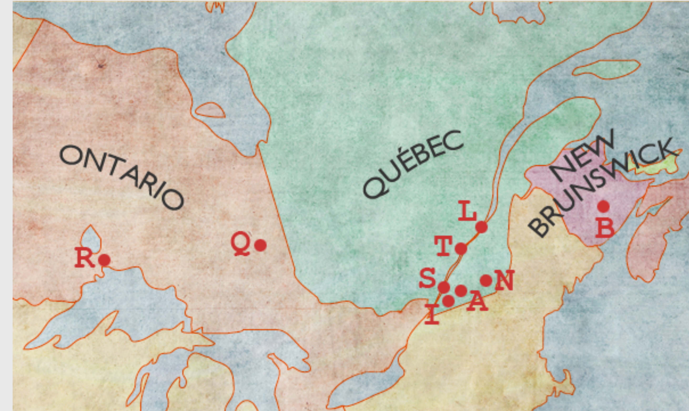
Les camps d'internement au Canada.

Près de 70 000 immigrants trouvent refuge en Grande-Bretagne avant le déclenchement du second conflit mondial. Rapidement, les autorités britanniques instaurent des tribunaux dont la mission est de déterminer qui, des nationaux allemands et autrichiens âgés de plus de 16 ans, représentent une menace pour la sécurité du pays. Les éléments les plus dangereux sont directement internés, la très grande majorité est laissée libre. Au printemps 1940, la menace hitlérienne se rapprochant, la Grande-Bretagne décide d' interner tous les ressortissants des pays ennemis. Elle demande et obtient la prise en charge de quelques milliers d'individus par l'Australie et le Canada . Ce dernier ne pense « accueillir » que des prisonniers de guerre .