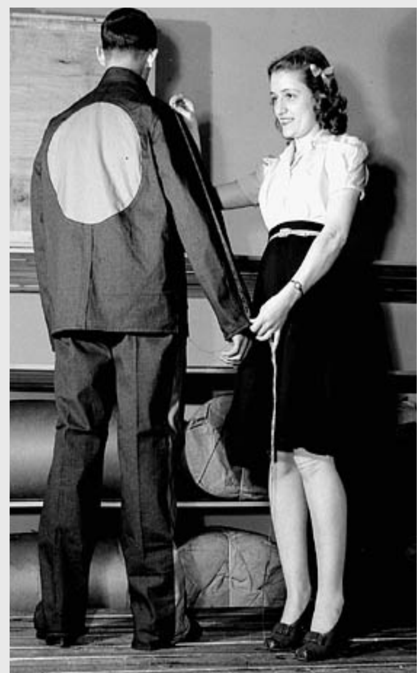
L'uniforme des prisonniers de guerre.

Sur les 6800 personnes que prend en charge le Canada, près de 2000 sont considérées par la Grande-Bretagne comme « réfugiés de l'oppression nazie». Cependant, le Canada ne reconnaît ce statut qu'en juillet 1941 . Des civils juifs sont donc internés pendant un an avec des prisonniers de guerre allemands et des sympathisants nazis. Les tentes temporaires sont rapidement remplacées par des baraques en bois ; les organisations d'aide obtiennent des autorités la mise en place d'activités sportives, culturelles et éducatives. Ainsi les réfugiés peuvent-ils passer des examens universitaires canadiens, entreprendre une reconversion professionnelle au sein même des camps. Dès la reconnaissance de leur statut, les internés rêvent d'une libération rapide. Le dernier quitte le camp à la fin de l'année 1943.